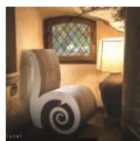
Carton Factory - Sedia Chiocciola