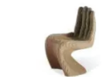
Carton Factory - Sedia Mano