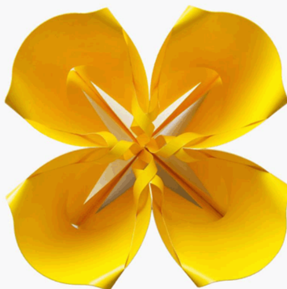
Светильник для общественных интерьеров "Сплетение"

В рамках RDP 2.0 Milan edition планируется следующая программа: