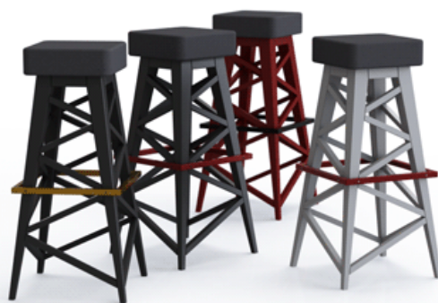
барные стулья БРЕНТ