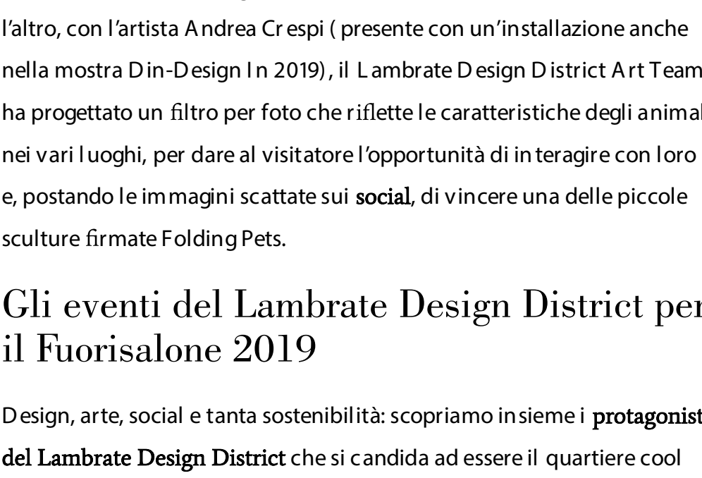
Panoramix (Facebook @ LambrateDesignDistrict)

( https://www.diredonna.it/salone-del-mobile-2019-date-biglietti-espositori-3256667.html ), con mostre, party, novità, food & drink sotto lo slogan "BACK to the SUBURBS" (orari dalle 10 alle 20, apertura straordinaria il 10 aprile fino a mezzanotte, la domenica gli eventi terminano alle 18).