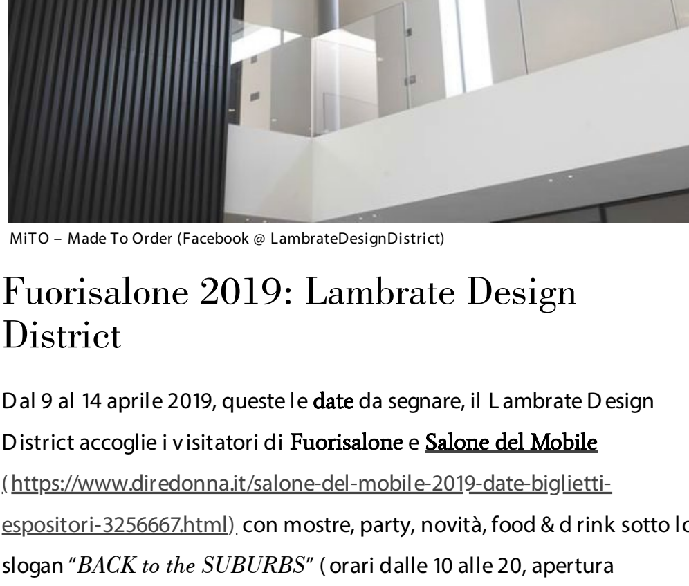
MITO - Made To Order (Facebook @ LambrateDesignDistrict)

Non è un caso, infatti, che quest'anno inizi la partnership del Lambrate Design District con NYCxDESIGN , il più grande evento newyorkese dedicato al design (dal 10 al 22 maggio a New York).