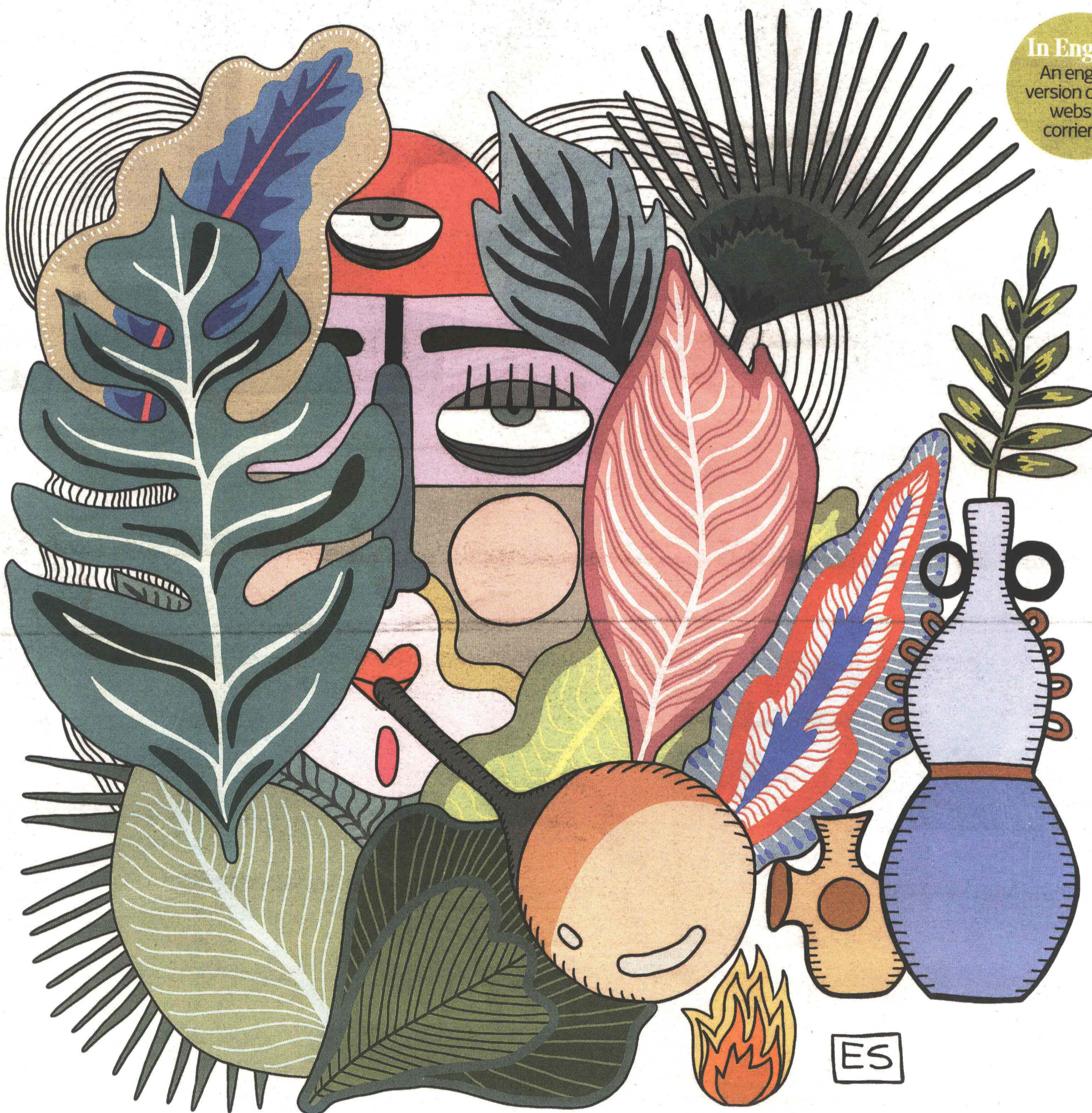
ILLUSTRAZIONE DI ELENA SALMISTRARO

An english version on the website corriere.it