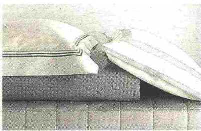
Nel bianco La Suite, divisione di Somma 1867

Al Salone del Mobile 2019 (Padiglione 3- L30) il gruppo presenterà un'altra importante svolta: la nascita di La Suite, divisione di Somma 1867 dedicata al contract, ossia collezioni per hotel, centri benessere, yacht e residential. «Si tratta di un marchio che utilizziamo da tempo per questo tipo di forniture, pur non avendolo mai reclamizzato —